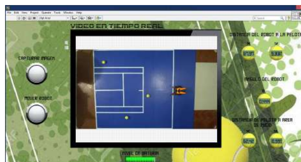
Figura 2. Software de control para el sistema de recolección.

Finalmente, en el centro se encuentra una pantalla virtual que muestra el movimiento en tiempo real del robot, y debajo de la misma un indicador de nivel de carga de las baterías del equipo, para conocer el estado de las mismas. La interfaz gráfica fue diseñada con un tema alusivo al tenis en tonos de contraste verde que le da un aspecto visualmente atractivo.