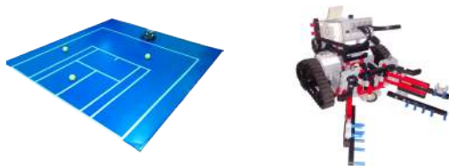
Figura 1. Área de trabajo y Robot recolector.

una altura de 1,07 m. La red estará totalmente extendida de manera que llene completamente el espacio entre los dos postes de la red y la malla debe ser de un entramado lo suficientemente pequeño para que no pase la pelota de tenis. La altura en el centro de la red será de 0,914 m, en donde estará sostenida mediante una faja. Habrá una banda cubriendo la cuerda o el cable metálico y la parte superior de la red. La faja y la banda serán blancas por todas partes.