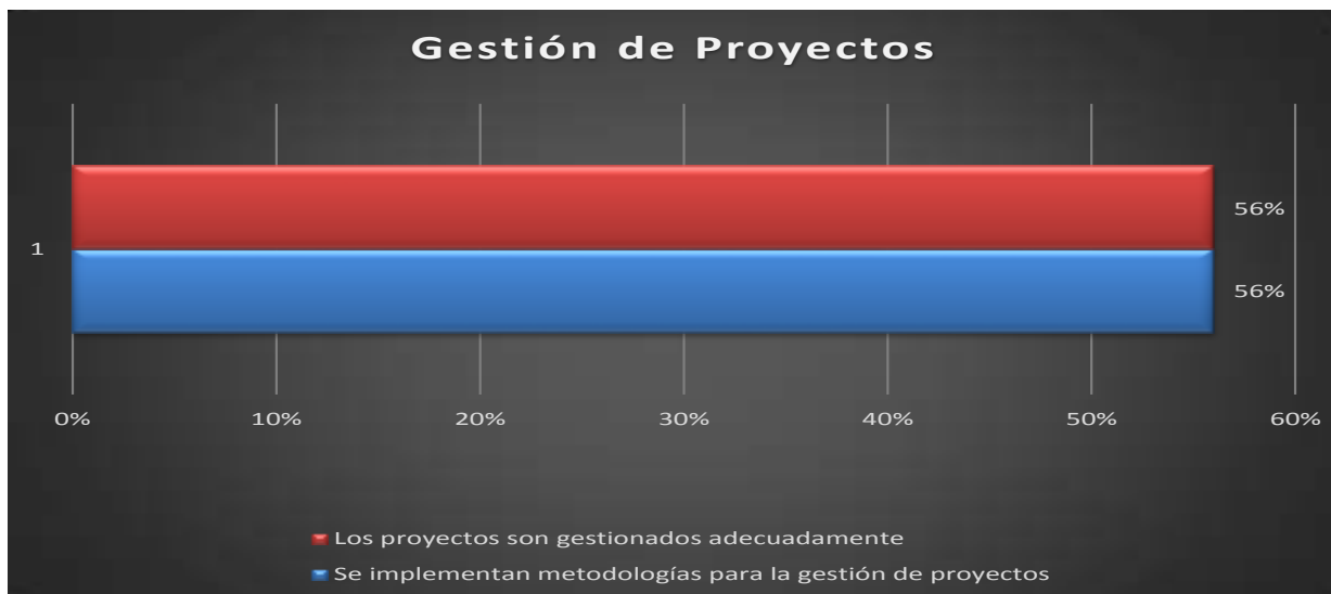
Gráfica 4. Gestión de Proyectos