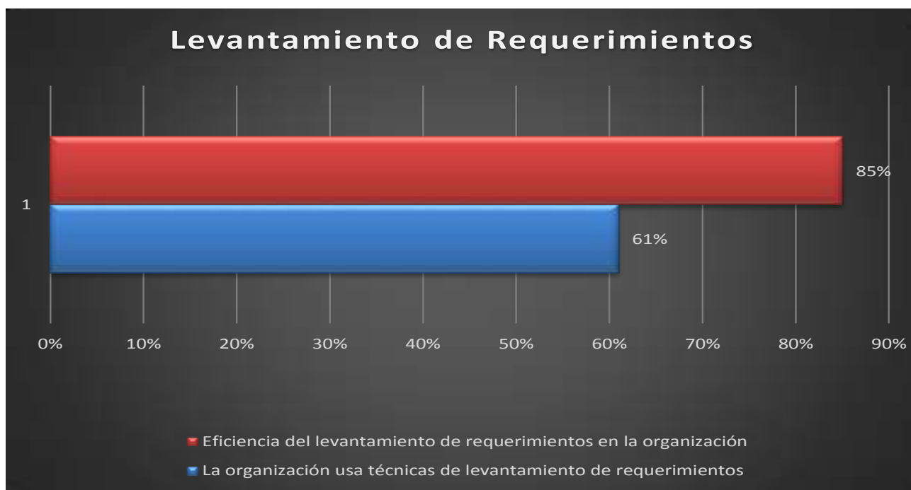
Gráfica 5. Levantamiento de requerimientos

Analizando las posibles causas de los resultados se encontró que: hay falta de claridad en los procesos, es difícil reunir a todas las personas involucradas debido a que pertenecen a diferentes áreas, no hay igualdad de criterios, hay desconocimiento de los procesos que generan los insumos o de los procesos que reciben el resultado del proceso evaluado, después de finalizado el levantamiento de requerimientos comienzan a surgir temas que no se tuvieron en cuenta o fueron omitidos y son fundamentales para la definición de las especificaciones o diseños funcionales.