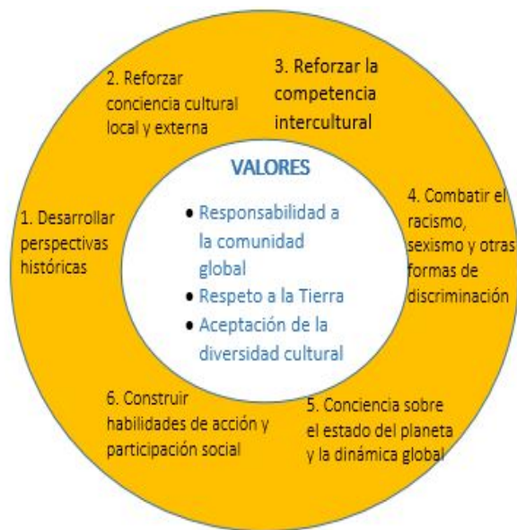
Figura 2. Comprehensive Multicultural Education: Theory and Practices. Fuente: Bennet, C. (1995) Comprehensive Multicultural Education: Theory and Practices. P. 301

integrar el componente internacional al microcurrículo y al trabajo autónomo de los estudiantes: