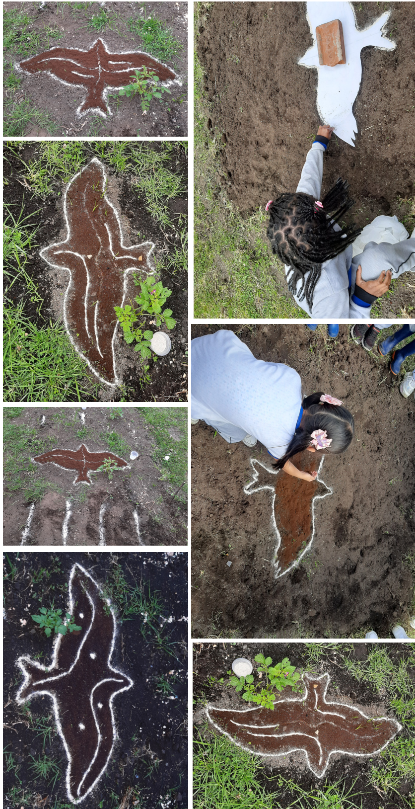
Imagen 3. Proceso con entidades telúrico-nutrientes, IED Estanislao Zuleta, Usme, (2022).