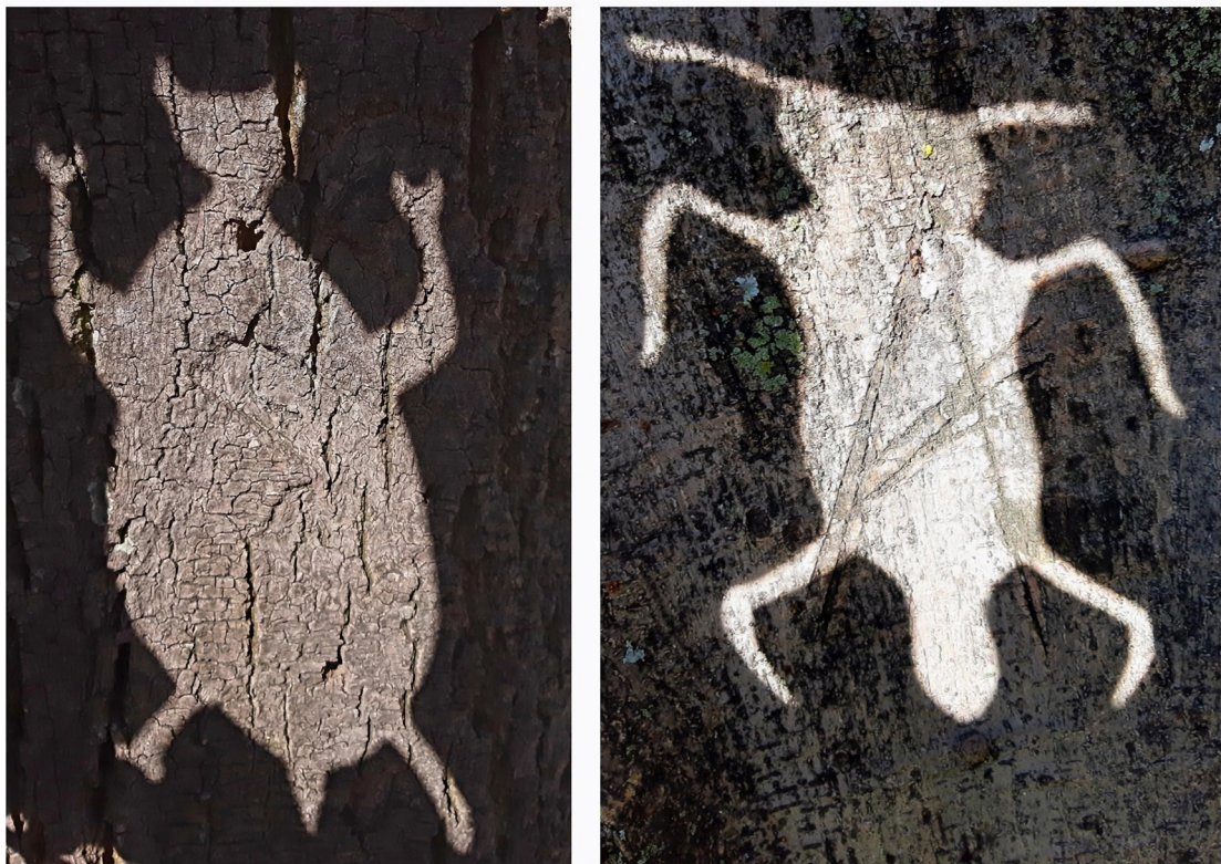
Imagen 2. Entidades fotomórficas mutantes en la Escuel Rural Pueblo nuevo, Ubaque (2022).

los árboles. Con ello se suscitaron reflexiones acerca de la expresividad dañina, que no respeta ni cuida los entornos biofísicos, a diferencia de nuestras creaciones que, además de ser efímeras, resultan inofensivas para los territorios.