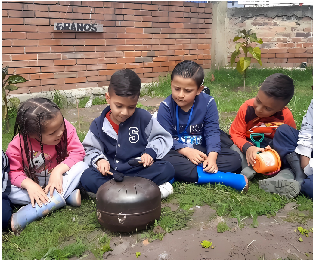
Imagen 4. Exploración sonora en los sembradíos, IED Estanillao Zuleta, Usme (2022).