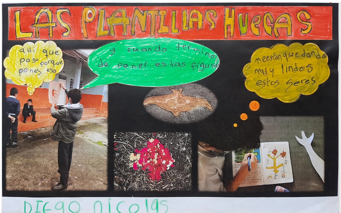
Imagen 1. Narrativas mestizas en la Escuela Rural Pueblo Nuevo, Ubaque (2022).