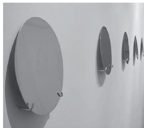
Imágenes de la exposición Aliento , en http://dintev.univalle.edu.co/cvisaacs/OSCAR_MUNOZ/viewer.swf