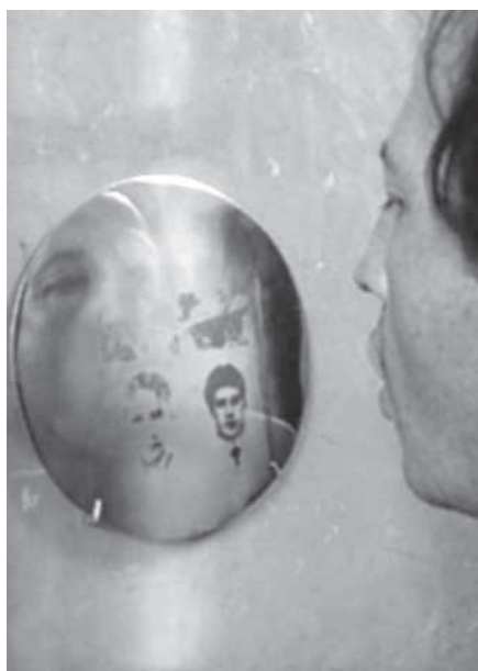
Aliento, 1995, Doce discos metálicos, serigrafía sobre película grasa, 20 cm de diámetro cada uno.

En ese sentido, la pregunta que orientó la investigación fue, ¿pueden las imágenes propuestas en Río abajo y Aliento configurarse como dispositivos que provoquen un proceso de memoria? Para desarrollar esta cuestión fue necesario plantear otras preguntas de análisis mucho más específicas, ¿qué es la imagen fotográfica?, ¿la imagen fotográfica presenta o representa la ausencia?, ¿puede la imagen fotográfica configurarse como testimonio o testigo? Estas cuestiones serán desarrolladas a lo largo de este artículo con el apoyo de algunos postulados teóricos planteados respecto a la relación entre imagen y memoria.