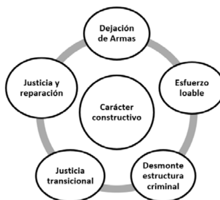
Figura 1. Carácter constructivo del proceso de paz

En torno al carácter constructivo del proceso de paz desde la percepción de los maestros se logra ubicar en el contenido las siguientes categorías como: dejación de armas, esfuerzo loable, desmonte estructura criminal, justicia transicional (que no satisface), justicia y reparación (Figura 1).