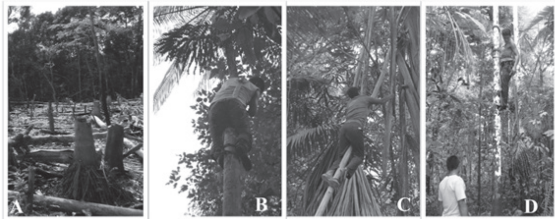
Figura 3. Métodos de cosecha de los frutos de Euterpe precatoria registrados en San Martín de Amacayacu. A) tala, B) escalada con pecoña, C) escalada con rampa, D) escalada con estrobos

yacu cosechan frutos para el consumo de su hogar (alrededor de 39.4-59.5 kg/persona), mientras que apenas siete familias lo hacen con fines comerciales. De acuerdo con estas cifras, se estima que se cosechan entre 1672 y 2500 individuos anualmente (19.4-29 toneladas, respectivamente) para abastecer las necesidades de los hogares, mientras que para la venta se cosechan entre 78 y 241 individuos (0.9-2.8 ton, respectivamente). Aunque esta cifra es variable pues depende de encargos realizados por comercializadores y de la necesidad de las familias de percibir ingresos adicionales. En total, cada año se cosechan cerca de 1750 a 2740 individuos de asaí, de los que se obtienen 20.3-31.8 ton en cada época de fructificación.