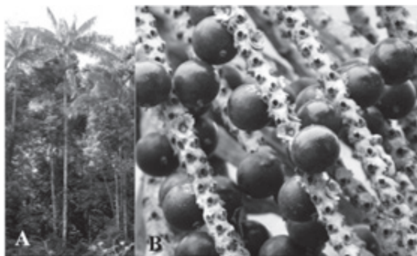
Figura 1. A) Hábito de Euterpe precatória , B) detalle de los frutos en la infrutescencia

con mesocarpio delgado y jugoso, y semillas esféricas con endospermo homogéneo (Henderson et al. , 1995; Galeano & Bernal, 2010) (figura 1).