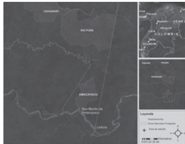
Figura 2. Ubicación geográfica de los sitios de estudio: San Martín de Amacayacu y Leticia, departamento de Amazonas

urbano y 9300 más en el área rural, agrupando al 50% de la población del departamento. Debido a su importancia geográfica y social, se desarrolla un comercio regional muy activo, que tiene como centro de acción el río Amazonas. Las principales actividades económicas del municipio de Leticia son la pesca, la explotación maderera, la agricultura, el turismo y la comercialización de productos del bosque (DANE, 2005). En Leticia los muestreos se realizaron en bosques estacionalmente inundables del kilómetro 17 de la vía que conduce a Tarapacá, los cuales reciben la influencia directa de la microcuenca del río Tacana, que es un cuerpo de aguas negras, con baja carga de sedimentos y baja concentración de nutrientes. Los suelos de esta área corresponden a llanuras aluviales de las formaciones Amazonas y Pebas, de origen sedimentario del Terciario (Arias 2007), y presentan drenaje medio a lento y texturas finas a medias (arena gruesa sobre arcilla) (Lima da Costa et al. , 2011).