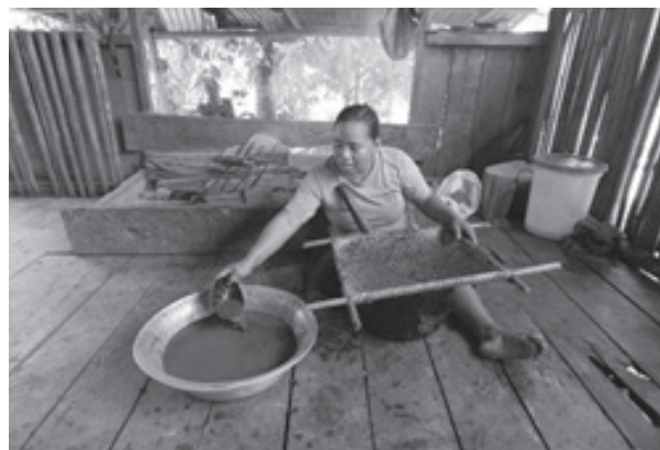
Figura 4. Procesamiento de frutos de Euterpe precatoria para la preparación de jugo en San Martín de Amacayacu

El fruto se consume principalmente en forma de jugo, elaborado a partir del mesocarpio, que es la parte comestible del fruto. Para que el mesocarpio o pulpa del fruto se ablande y la preparación del jugo sea más fácil, se dejan remojando los frutos en agua tibia por dos horas; después de esto se maceran con la mano o con un mazo de madera, añadiendo agua paulatinamente a medida que la pulpa se desprende de la semilla. Una vez se tiene un jugo espeso que contiene las semillas y partes de exocarpio, se filtra usando un cernidor hecho de fibra de Desmoncus polyacanthos Mart., y se agrega más agua para facilitar el proceso (figura 4).