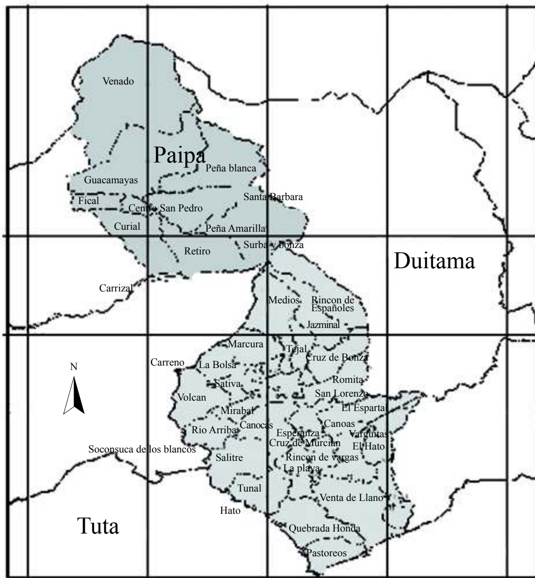
Figura 1. Mapa de los municipios de Paipa y Duitama.

un total de 27766 habitantes. La población urbana cuenta con 15428 habitantes y en la zona rural se estima una cantidad de 12338 personas. En el POR (Plan de Ordenamiento Territorial del Municipio de Paipa) 2000–2009 se identifican 3021,815 ha. en bosques con un total de 24 fragmentos mayores a una hectárea. El corregimiento de Palermo, corresponde al 40% del área del territorio municipal y allí se encuentra el 13.2% del total de la población. El municipio en su área rural se dedica a actividades agrícolas y ganaderas que son el principal soporte económico de las 12338 personas que lo habitan.