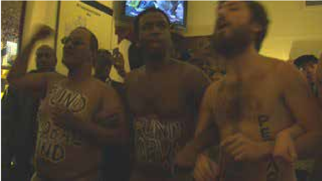
▲ Figura 2. ACT UP. Acción en la Cámara de Representantes de EE.UU en contra de los recorres presupuestarios de los programas nacionales y mundiales sobre el sida, 2012.