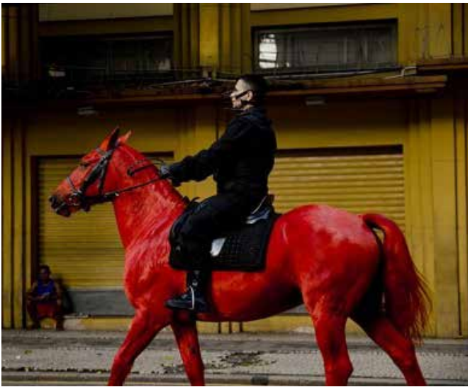
▲ Figura 9. Berna Reale. Palomo, 2012. Performance.