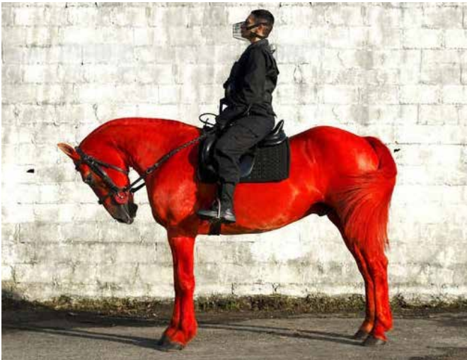
▲ Figura 10. Berna Reale. Palomo, 2013. Fotografía de la performance. Fotografía de La Galería Millan