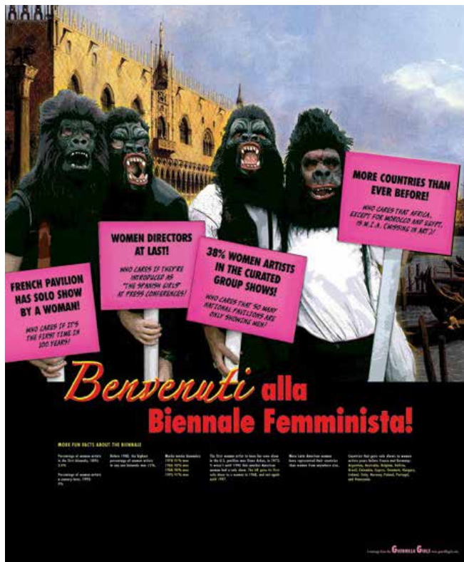
▲ Figura 3. Guerrilla Girls. Cartelería presentada en la Bienal de Venecia, 2005. Fotografía de Guerrilla Girls.

En la Bienal de Venecia del año 2005 exhibieron, a modo de carteles publicitarios de grandes dimensiones (figuras 3 y 4), seis mensajes de carácter crítico hacia la política de la propia institución organizadora, hacia los museos de la ciudad que acoge la muestra, Venecia, y al cine de Hollywood.