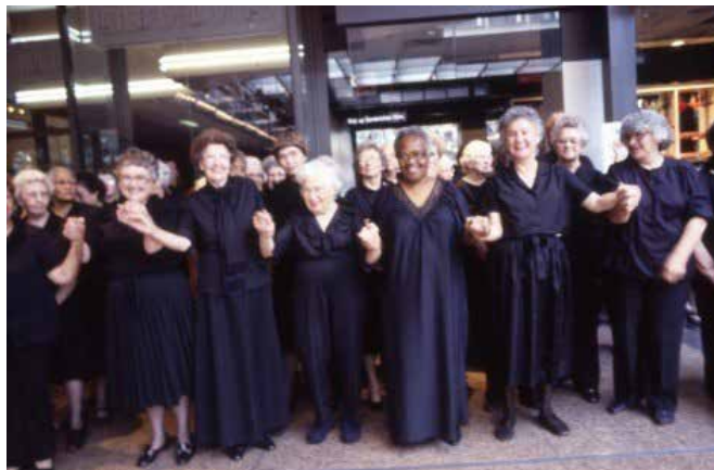
▲ Figura 6. Suzanne Lacy. Silver Action , 2013. Mujeres mayores de 60 años que desarrollan la acción propuesta para el BMW Tate en vivo, Londres, 2013.