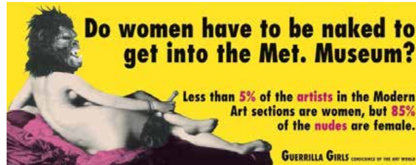
▲ Figura 4. Guerrilla Girls. Cartelería presentada en la Bienal de Venecia, 2005.

[¿Por qué las mujeres tienen que estar desnudas para entrar en el Museo? Menos del 5% de los artistas en las secciones de arte moderno son mujeres, pero el 85% de los desnudos son femeninos.]