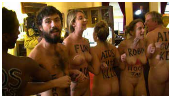
▲ Figura 1. ACT UP. Acción en la Cámara de Representantes de EE.UU en contra de los recortes presupuestarios de los programas nacionales y mundiales sobre el sida, 2012.

y así poder alcanzar todas aquellas políticas necesarias que permitan paliar la enfermedad. Una de las últimas acciones (figuras 1 y 2) consistió en ingresar totalmente desnudos, con inscripciones en sus cuerpos, en la oficina del Presidente de la Cámara de Representantes de EE.UU, John Boehner, con el objetivo de detener los nuevos recortes presupuestarios en los programas nacionales y mundiales sobre el sida.