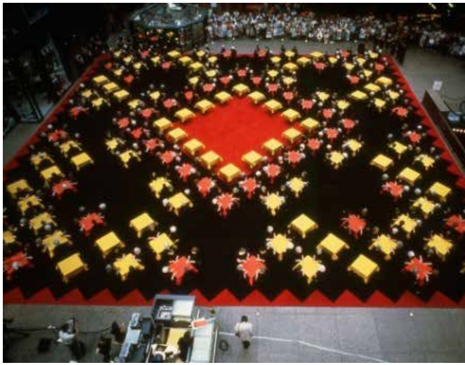
▲ Figura 5. Suzanne Lacy. Crystal Quilt , 1987. Escena perteneciente a la acción realizada por más de 430 mujeres en Minneapolis, 1987.