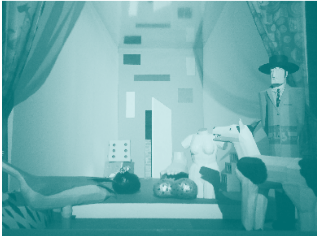
▲ 53 rd International Art Exhibition Making Worlds , Fotografía: usuario Flickr Stefano Meneghetti