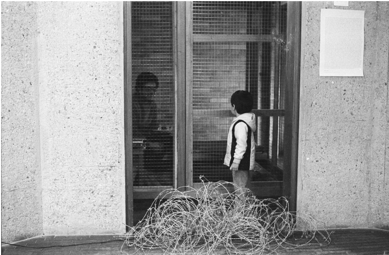
Imagen 1. Trampa . (Fernando Cepeda, 1980). VI Salón Atenas, Museo de Arte Moderno, Bogotá. Fotografía de Oscar Monsalve (Bogotá, 1980).