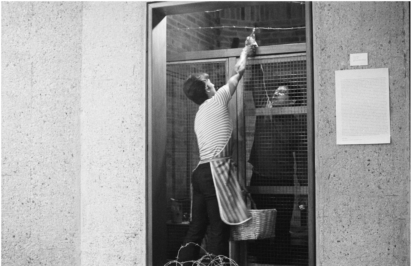
Imagen 2. Trampa . (Fernando Cepeda, 1980). VI Salón Atenas, Museo de Arte Moderno, Bogotá.