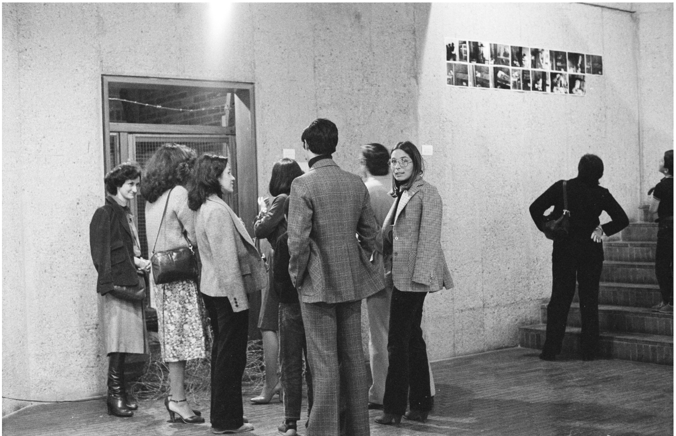
Imagen 3. Trampa . (Fernando Cepeda, 1980). VI Salón Atenas, Museo de Arte Moderno, Bogotá.