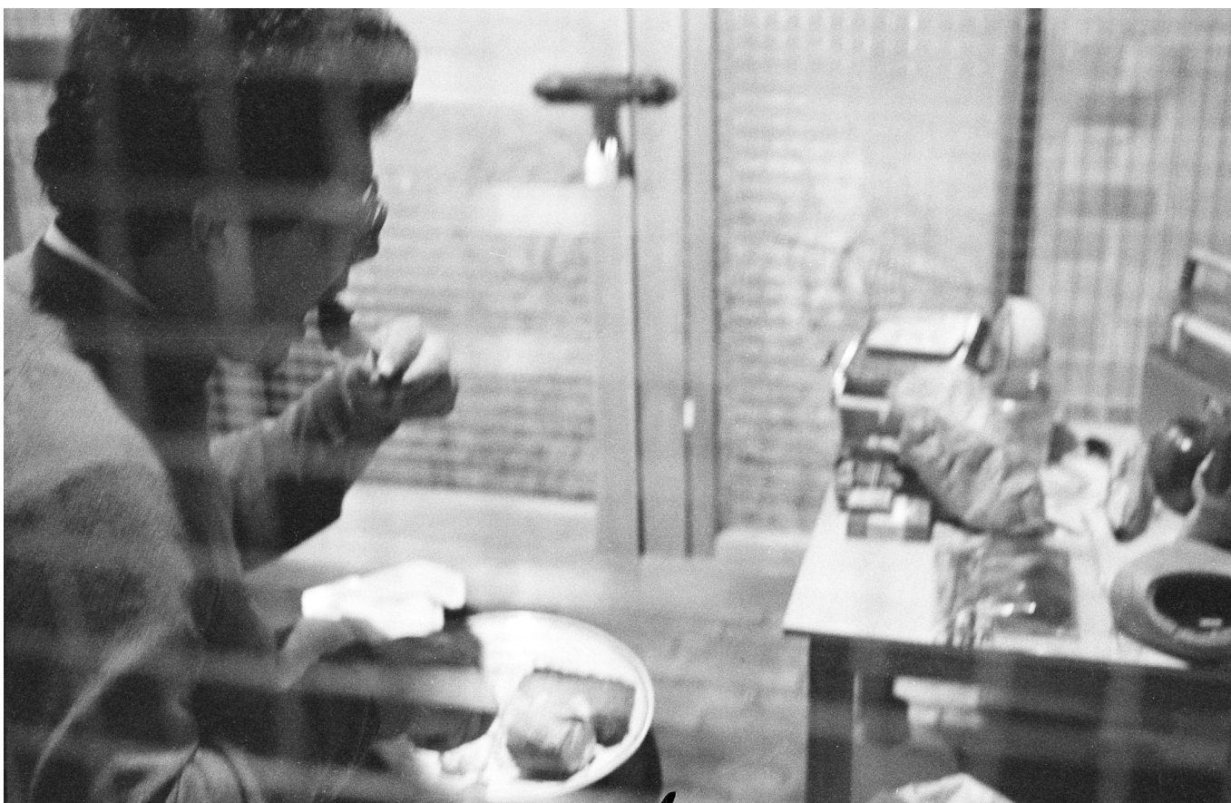
Imagen 5. Trampa . (Fernando Cepeda, 1980). VI Salón Atenas, Museo de Arte Moderno, Bogotá.

convertían el tribunal en un espacio de comunicación política, un uso del texto, el cuerpo y la comunicación que poco difería del arte de procesos.