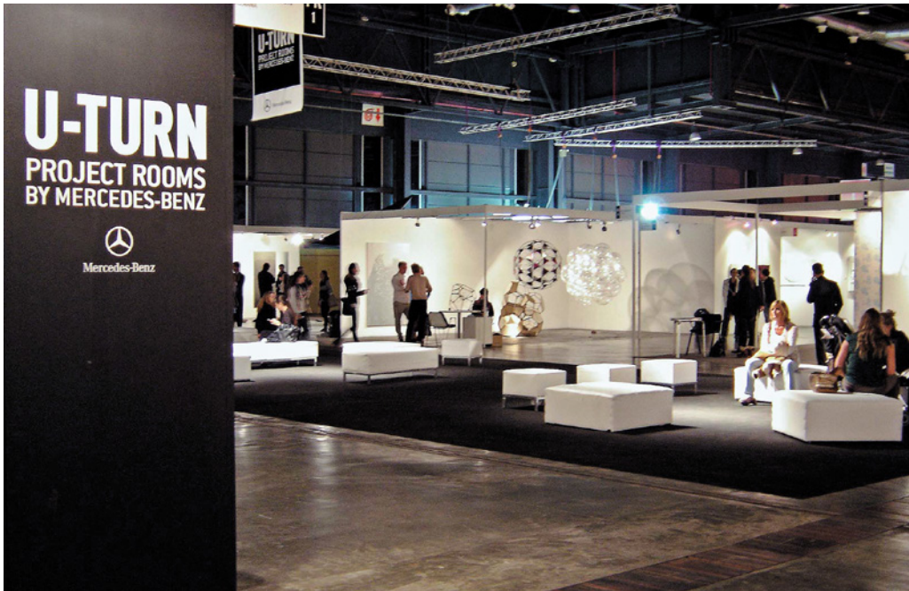
Figura 8. Vista de sección U-Turn en arteBA 2011. "Space elevator/Spark 460" (Tomás Saraceno, 2010) en la galería Andersen's Contemporary.

evidencian una actitud, un modo de colocarse ante el medio y el mercado" (Lebenglik 2003, s/p).