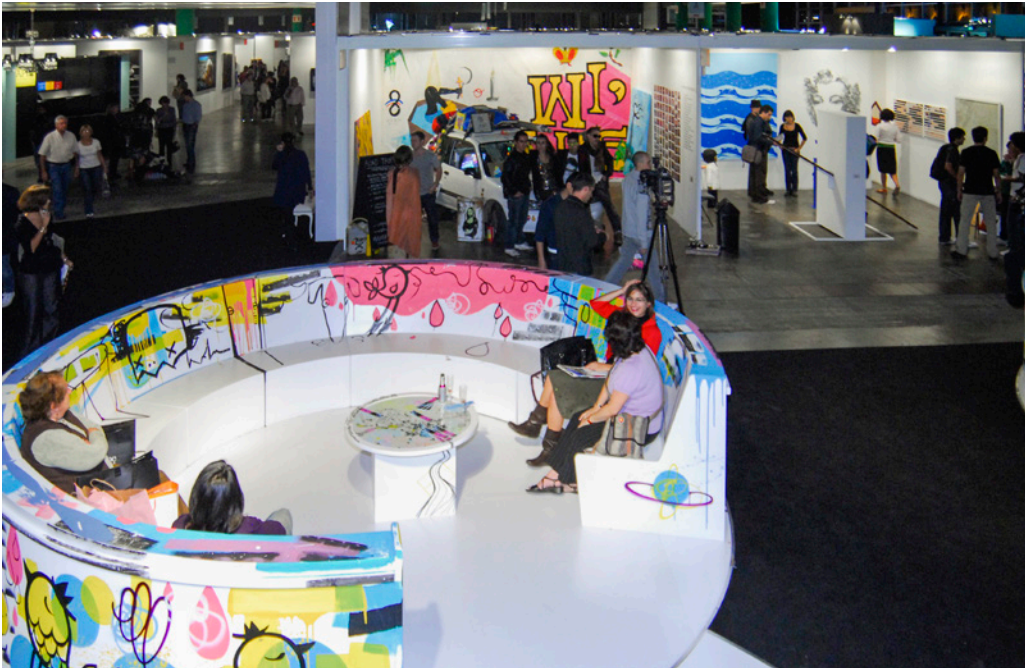
Figura 7. Vista de sección Barrio Joven en arteBA 2009. De izquierda a derecha: galerías Corazón de Bully, Espacio La Punta y Traffix.

Al año siguiente, esta muestra se transformó en una sección de galerías denominada “Nuevas expresiones del arte” y presentó a MOTP Arte Contemporáneo, Sonoridad Amarilla, Van Riel (que instaló un espacio en la sección principal también), Lelé de Troya, Ruth Benzacar (al igual que Van Riel, presente en ambas secciones), Elsi del Río, Instantes Gráficos, Consorcio de Arte de Buenos Aires, Espacio Vox y Belleza y Felicidad. 7 El reconocimiento de la centralidad de estas galerías autogestionadas en un contexto de crisis profunda en el cual se desintegraban los lazos sociales y, también, se desfinanciaba por completo a las instituciones artísticas oficiales, hace explícito un cambio en la escena local y en las maneras de circulación del arte.