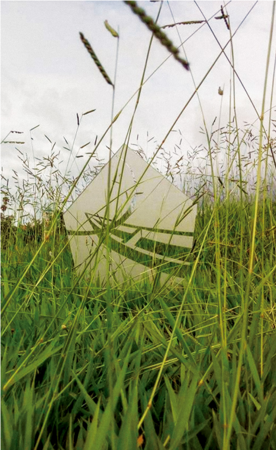
Figura 1. Shambo, F (2017) "De transparencias y opacidades". Instalación. Dibujo sobre lámina de acrílico.