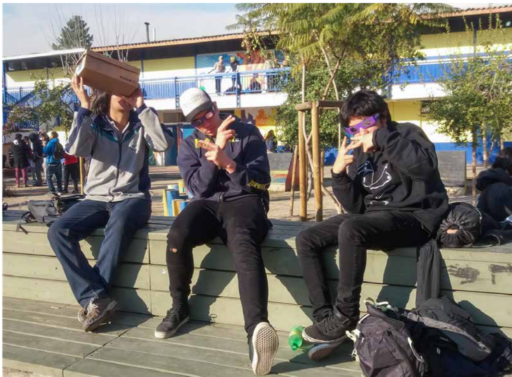
Trabajo de campo (2020).

negadas por la exclusión y la movilidad social detenida. En donde se originó otro lenguaje, posibilitando otras formas de expresión que lograron manifestarse en demanda de transformaciones sociales. En estas nuevas formas de expresión encontraron cabida las culturas híbridas, donde además se encuentra la narcocultura. En ella los marginados se reinventan, se deconstruyen en demanda de un cambio social que los considere y no los segregue.