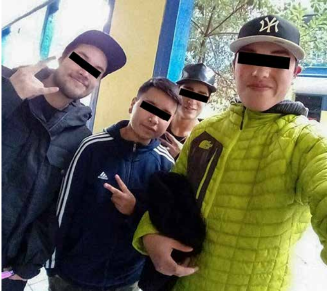
Trabajo de campo (2020).

rizomático, es decir más flexible y abierto que una educación arbórea lineal y binaria