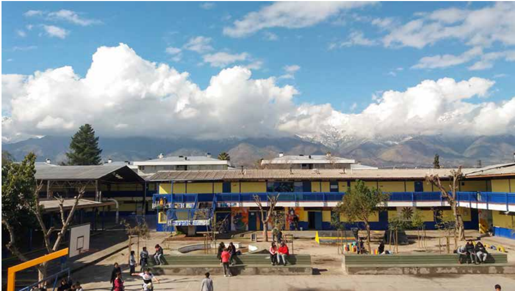
Trabajo de campo (2020).

que finalmente lo va construyendo como sujeto. En la subcategoría del análisis, referida a la naturalización del uso de droga, el estudio de SENDA parece confirmar esta idea; sobre todo cuando los padres parecen ir aceptando con mayor soltura el consumo de marihuana.