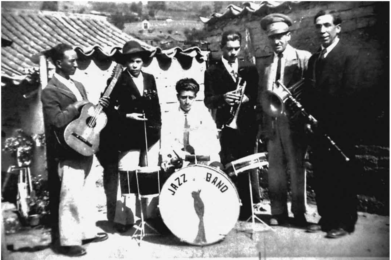
Imagen 1. Músicos de provincia integrantes de una Jazz Band (Norte de Santander, 1930).

con posterioridad las vías férreas en las sabanas, llanuras, valles y cordilleras de Colombia, más no se trata tan solo de referenciar como fue la historia de los caminos de Colombia, la intención inicial parte de destacar el papel que desempeñaron las vías, como puentes de dispersión de la música en forma de tradición oral y escrita, relacionados con el despliegue de formatos musicales tipo Big-Band , en asocio con el progreso de las vías férreas en Colombia (Osorio, 2014, p. 3)