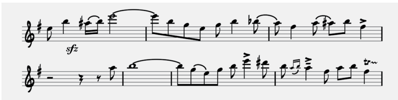
Imagen 2. Fragmento de la improvisación en Clarinete: Bb, del maestro: Lucho Bermúdez, en el porro Fiesta de Negritos. Transcripción: Realizada por los autores (Elaboración Propia).

de un panorama distinto al que la sociedad colombiana estaba acostumbrada en el entorno musical.