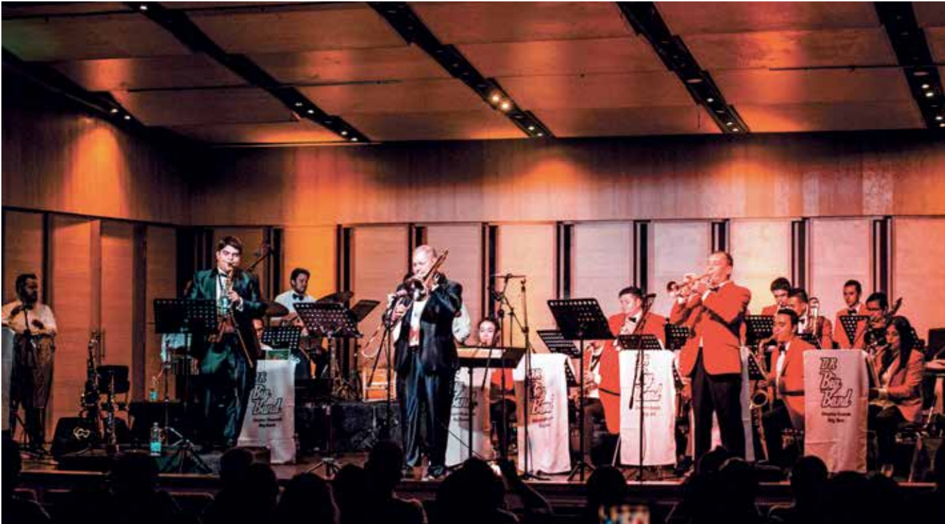
Imagen 4. Big-Band Universitaria.

inclusión de la música en la memoria colectiva de la historia musical del país.