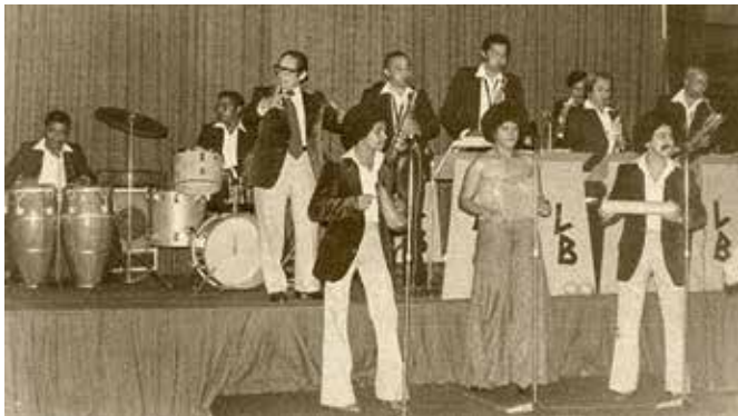
Imagen 3. La famosa Big-Band: de Lucho Bermúdez.

Posteriormente, en 1978 se organiza la Colombia All Stars, con el propósito originario fue la salsa, de gran trascendencia dentro de las organizaciones musicales de gran número de músicos, por la calidad de integrantes que logró reunir su virtuosismo y tecnicismo, en lo citado a continuación, expresa la conformación efímera de este proyecto ambicioso, en su intención de emular la expresión musical de la Fania All Star, del Maestro Johnny Pacheco, generando una conciencia musical local y regional.