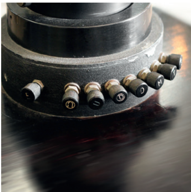
Figs. 5 y 6. Telégrafo.