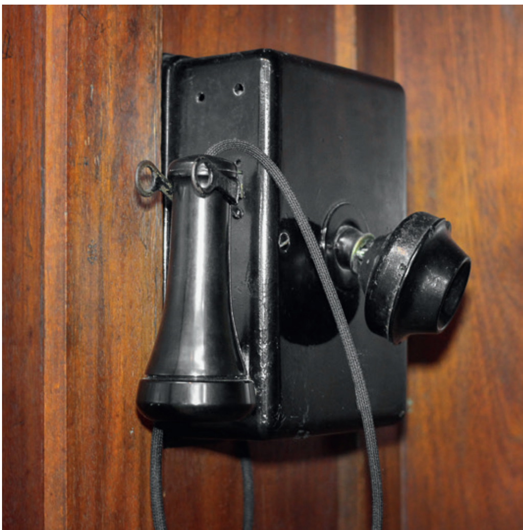
Fig. 4. Teléfono en la abina telefónica utilizada en Bogotá en los años 30 y 40.

el impacto de la brecha tecnológica? y ¿Cómo se combinará y articulará la tecnología de las telecomunicaciones con las demás tecnologías? En otras palabras, los museos generan cuestionamientos desde muchas perspectivas, implicando a todos los que participan de él en una suma de labores, técnicas, estudios y experiencias que compilan las respuestas a los planteamientos de la museografía como herramienta para el aprendizaje, se puede decir entonces que los museos son a la pedagogía y al conocimiento, como las vitrinas a los almacenes.