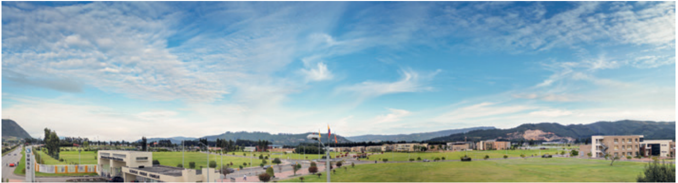
Fig. 2. Campus, Universidad Nueva Granada.

ancestrales o nativas utilizan un sistema de comunicaciones inalámbrico, conocido como maguaré , que consistía en dos tambores golpeados con un mazo de caucho que emitían señales sonoras con un código especial conocido por sus operadores. Estas eran enviadas hasta una distancia de 20 kilómetros, donde eran retransmitidos por otros y con los cuales se comunican acontecimientos importantes de las comunidades, como convocatorias a reuniones tribales, religiosas o festivas (Meyer, Dentel y Seifart, 2012).