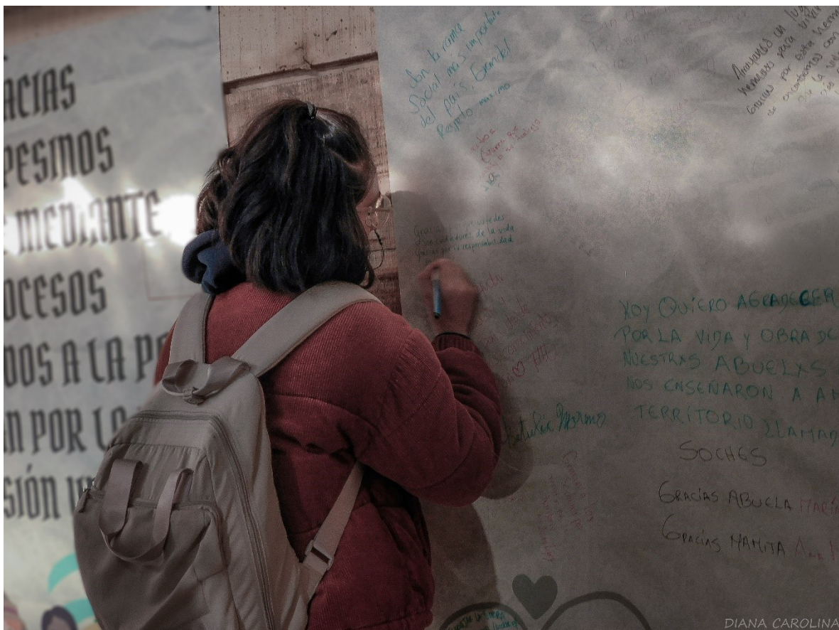
Figura 2. Describiendo el territorio

visibilizar las problemáticas y acciones de la comunidad, y hacer que las nuevas generaciones no abandonen sus territorios, sino que, por el contrario, puedan aportar en el mejoramiento de sus condiciones de vida, los procesos de resistencia y la defensa de los territorios.