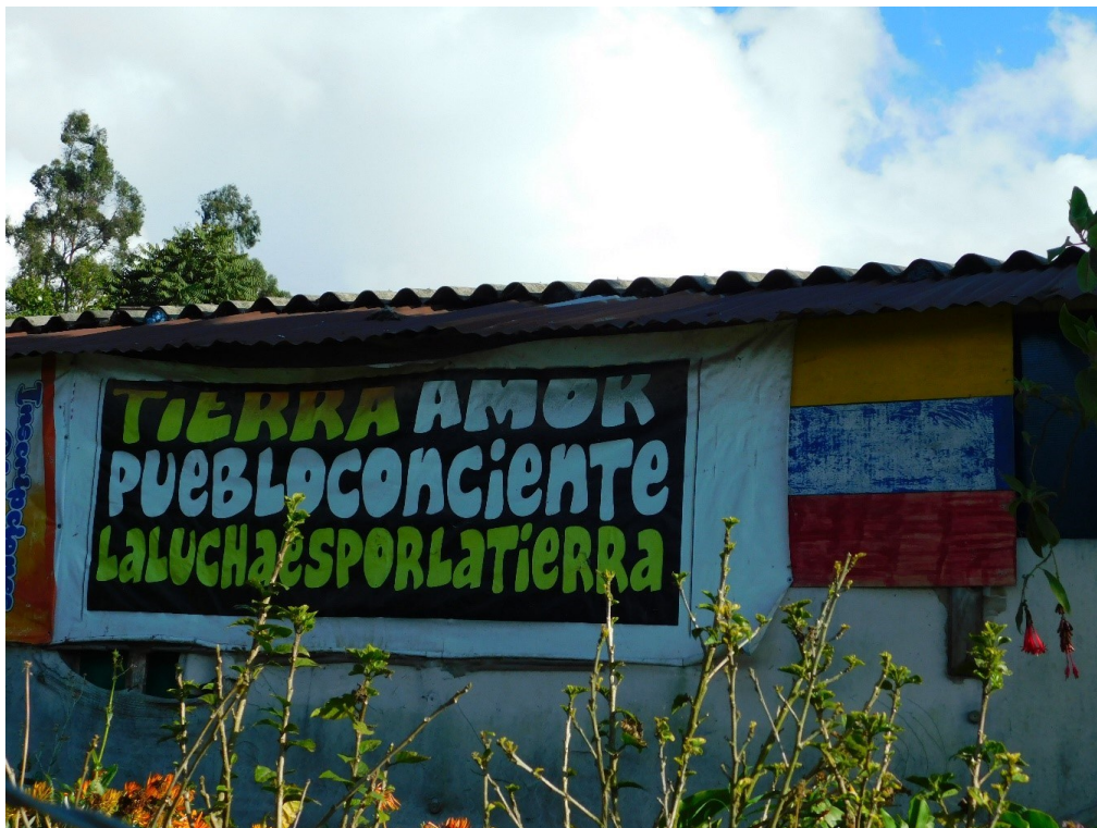
Figura 3. Resistencia campesina

En este sentido, se ha observado una discrepancia entre las necesidades actuales de la vereda Los Soches y las acciones ejecutadas por el actual proyecto territorial local, especialmente en lo que respecta a la conservación del patrimonio histórico y natural. Además, no se ha fortalecido la conservación del relevo generacional a través de la construcción de la identidad campesina, el empoderamiento comunitario y el desarrollo de habilidades empresariales y productivas locales que permitan el desarrollo rural en el territorio.