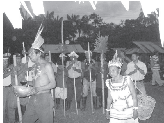
Figura 1. Baile tradicional indígena realizado en el Resguardo Ticuna Uitoto, 2008.

Todos los pueblos indígenas, hoy asentados en este pedacito de territorio, nos unen espiritualmente con el principio de la “Ley de Origen” (Ambil- Rapé) (Tabaco)-Mambé (Coca) y otros en su Yagé: todos con sus conocimientos de base cultural tradicional, manteniendo nuestras formas diferentes de hablar, de alimentarnos, para seguir sobreviviendo aquí [7], frase expresada en la ceremonia que se relaciona en la figura 1.