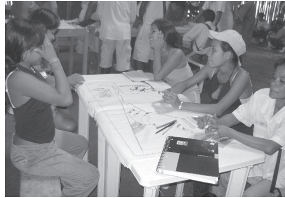
Figura 7. Elaboración de mapas por mujeres de la comunidad indígena, 2009.

La participación activa de los integrantes de cada grupo conformado para la determinación de las debilidades, oportunidades, fortalezas y amenazas de la zona específica, se reflejó en la elaboración de una matriz DOFA asociada a los contenidos visibles en los mapas, la presentación y socialización de cada mesa de trabajo a la totalidad de participantes, brindando una perspectiva detallada y complementaria de todo el resguardo o área de influencia territorial. Los siguientes son algunos de los productos cartográficos obtenidos del taller: