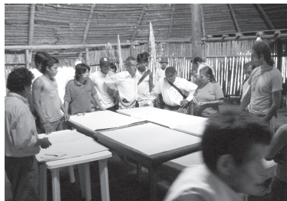
Figura 6. Mesa de trabajo y diálogo entre participantes del taller comunitario, 2009.

Continuando el acompañamiento al proceso de gestión territorial que se adelantaba en el resguardo indígena luego de concluir las actividades propuestas en el trabajo académico de investigación, en el 2009, se realizó una actividad comunitaria que permitió desarrollar algunos puntos señalados en el proceso previo. Este taller participativo contó con el acompañamiento técnico de integrantes de la fundación Fundaminga como parte de un proyecto denominado “Fortalecimiento del Consejo de Autoridades Tradicionales Indígenas del resguardo Tikuna Uitoto, km. 6 y 11, para la construcción participativa de estrategias de gestión territorial y su difusión (Leticia, Amazonas, Co-