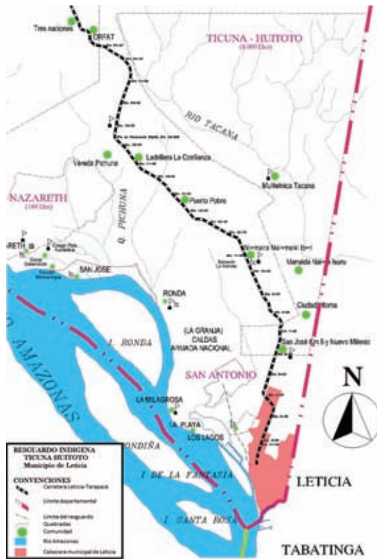
Figura 3. Mapa del resguardo indígena Ticuna Uitoto kilómetros 6 y 11, 2002. [20]

Un acercamiento inicial a los aspectos administrativos, físicoambientales, socioeconómicos y culturales de la zona permitió realizar confrontaciones, verificaciones, consideraciones y una comprensión integral de los conocimientos adquiridos de fuentes secundarias, de acuerdo a las apreciaciones, descripciones e información adquirida durante el trabajo de campo, interacción con miembros de las comunidades y participación de las actividades que programaban.