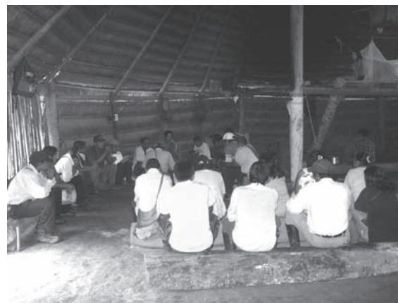
Figura 2. Reunión de socialización y discusión del trabajo de investigación con participantes del resguardo indígena Ticuna Uitoto, 2008.

elementos que reuniera las características especiales para plantear una herramienta técnica, moderna y viable que se ajustara a la situación actual de la zona étnica y respondiera a la necesidad de información espacial del resguardo indígena manifestada por los posibles usuarios. Sin embargo, la búsqueda de mecanismos y otras herramientas que permitieran cumplir los propósitos inicialmente concebidos, las limitaciones para adquirir información y productos de información espacial detallada del área, las características y particularidades del trabajo con comunidades indígenas, protocolos institucionales, el planteamiento ético y otros aspectos técnicos requeridos, determinó las cualidades que describiría la propuesta de conceptualizar un SIG participativo y una aproximación metodológica a él.