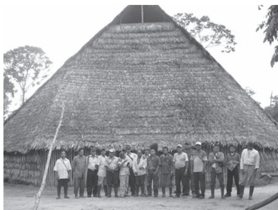
Figura 5. Líderes del resguardo indígena Ticuna Uitoto, 2008.

dades a distinguir en las herramientas tecnológicas (sistema de software y hardware ) y los criterios de selección de los integrantes del grupo de trabajo, en el que se resalta una necesaria predominancia de los habitantes de la zona. En cuanto a las precisiones administrativas, en el planteamiento se consideró: el aspecto económico, costos básicos y formas de participación que requiere el sistema de la organización indígena, en el que además, se relaciona la estructura y el personal de apoyo acorde a las características básicas de los SIGP, resaltando la fundamental participación y colaboración de la administración del resguardo en el proceso.