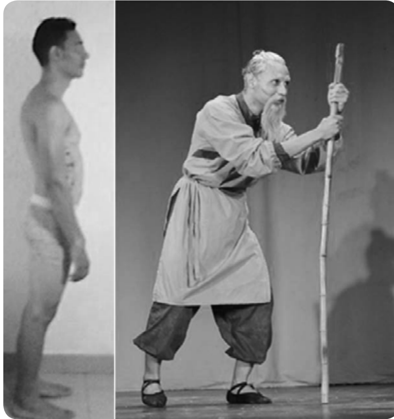
Imagen 1. Actor y Personaje. Cómo se salvó Wang Fo (obra de teatro).