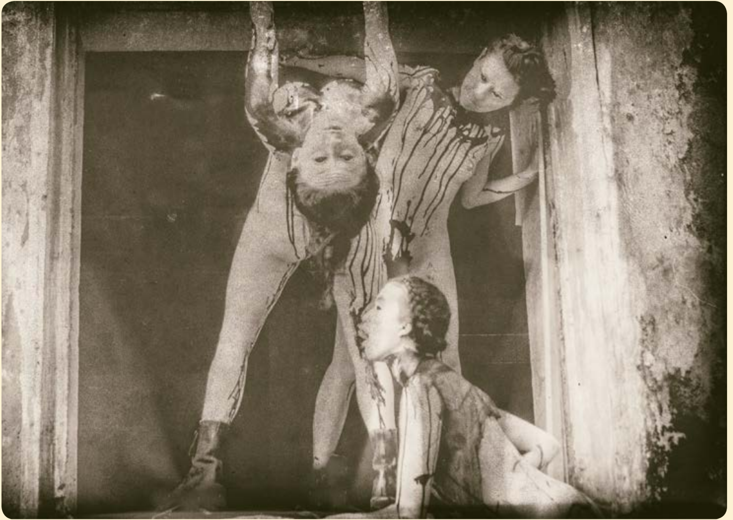
C.A.R.N.Experimento. Meta Carne. Performance (2015). Edición: Raúl Vidales.