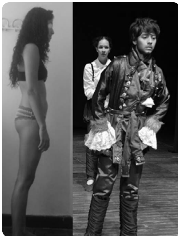
Imagen 2. Actriz y personaje. El vuelo de la Alondra (obra de teatro).

En el caso del personaje Wang Fo, de la obra de Yourcenar, se observa en el actor un aumento de la cifosis torácica, centro de gravedad y cabeza adelantados, generando tensión muscular en los músculos del cuello, pectoral y tibial anterior. Estas tensiones sumadas a la dificultad que presentaba este actor, en particular, de relajar adecuadamente sus músculos tanto en reposo como en actividad, evidenciando restricción en las fascias toracolumbares y llevaron a que la construcción de su